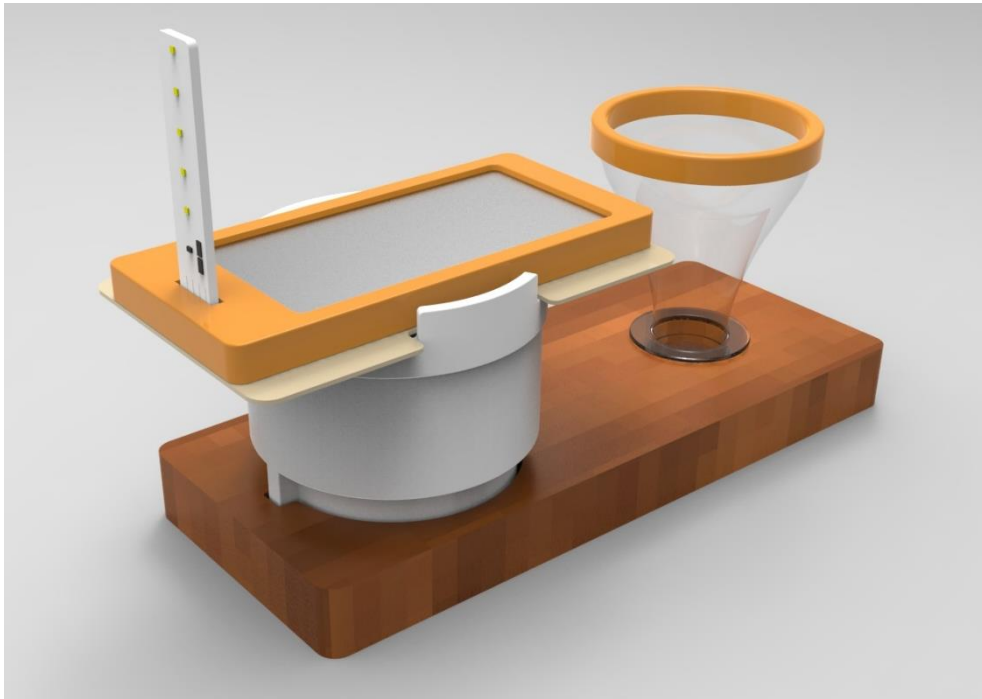
교육 교재용 DIY 키트 버전

21세기 호롱제품이 오지마을의 현지상황을 고려하여 나눔을 위한 탄자니아 버전과 국내등의 교육 교재로 사용될 DIY 키트 버전 두가지 제품으로 업그레이드 될 예정입니다. 탄자니아 현지의 효율적인 사용, 사후관리 및 현지생산을 감안한 탄자니아 버전은 현지의 부품조달 및 생산효율성을 중점적으로 적용하였습니다. 국내교육사업의 교재로 사용될 DIY 키트 버전은 상품성을 강화하여 과학교육을 통한 나눔활동에 사용될 것입니다.