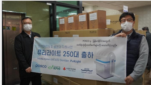
포스코(사회복지 공동모금회)- 퓨리라이트 250대 지원, 미얀마(2,000만원)