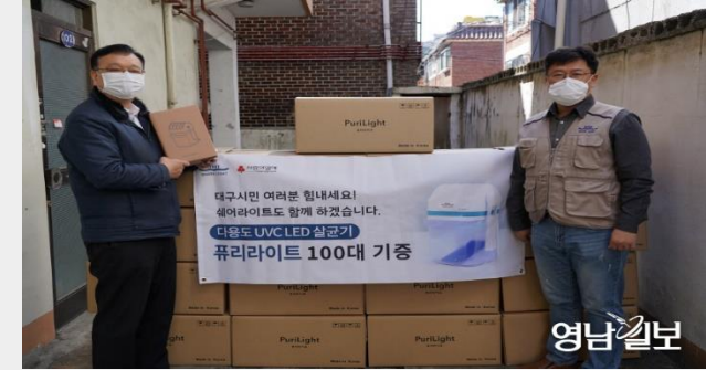
국내 코로나 피해 장애시설 지원: 1,100만원