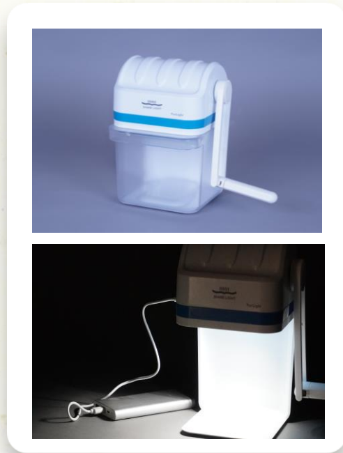
퓨리라이트 (UVC Water Sterilizer) 1680 set