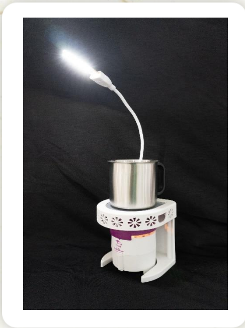
쉐어라이트 (Candle Powered LED 램프) 3500 set