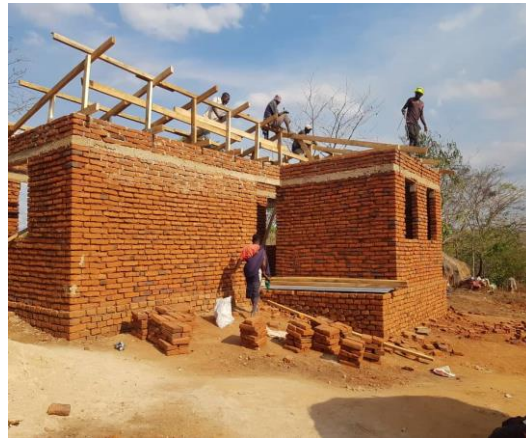
벽돌집짓기 사업 2022년 하반기부터