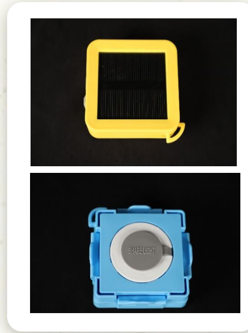
퓨리선 & 퓨리캡 (Puri Mini Water Sterilizer) 10,265 set