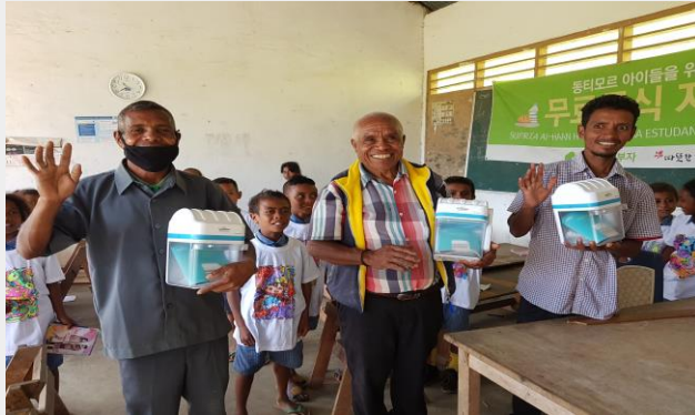
우양재단- 퓨리라이트 52대, 미얀마(500만원)