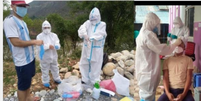
네팔 짜우르자hari 병원 코로나피해 지원: USD 1,000