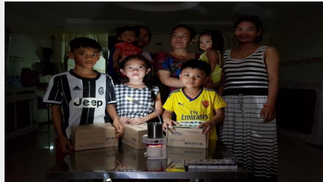
에너지관리공단 - 웨어라이팅 200 set, 라오스 캄보디아, 필리핀(1,500만원)