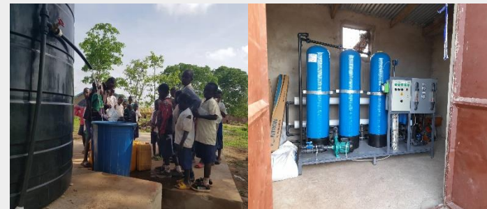
탄자니아 음가마 마을 정수필터 (RO filter)설치: 900만원