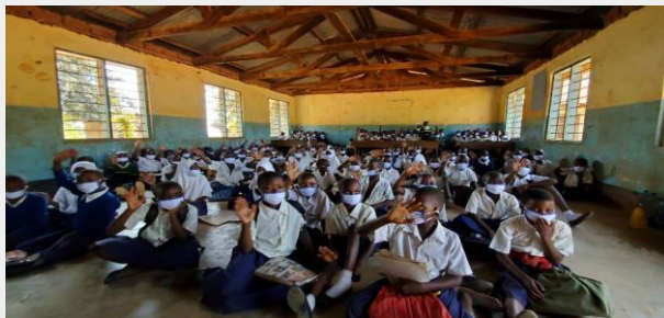
탄자니아 학교 마스크 지원: USD 100