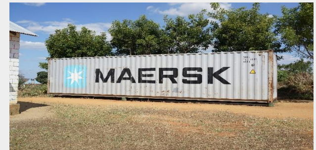
탄자니아 후원물품 보관 Container 설치: USD 6,500