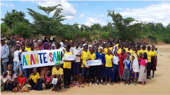
탄자니아 가뭄피해 긴급 식량지원; 1,337만 원