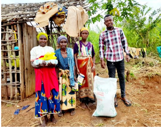
극빈가정 식량지원 2022년 하반기부터