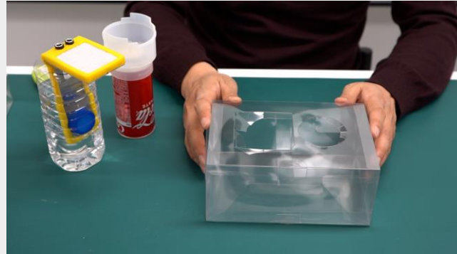
롯데 케미칼- 21세기 호롱 제품case 기부