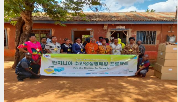
삼성자산운용- 탄자니아 물품지원 500만원 셀트리온- 탄자니아 물품지원 1,000만원