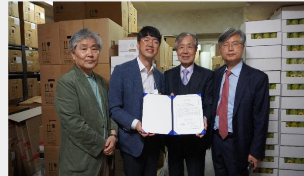
주은사랑- 모기퇴치용 씨트로넬라 여름향초 티라이트 28판 개입 X900판 기부