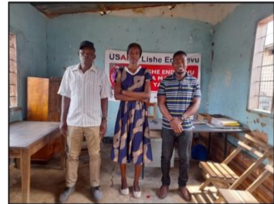
현지 청년리더양성 사업 2022년부터 시행